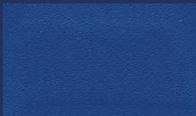
R-563 ROYAL BLUE