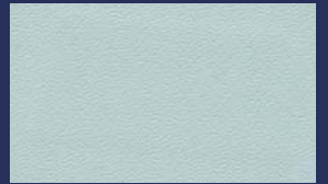
R-564 PEARL GREY