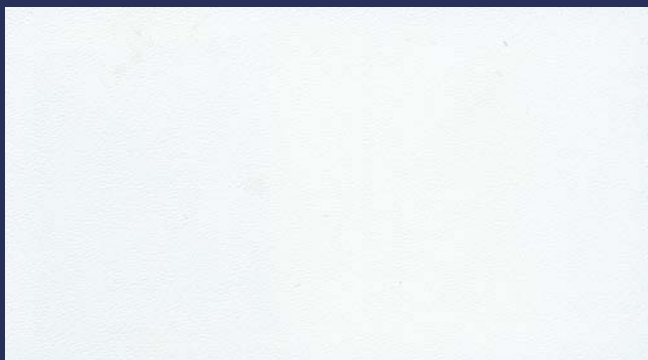
R-097 SNOW WHITE